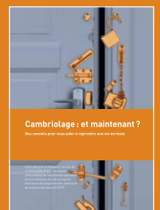
Dépliant, A5, 8 pages, 2015

Ce dépliant est conçu pour aider les victimes d'un cambriolage. Elles y trouvent des informations sur le travail de la police et cinq règles pratiques pour faire face aux conséquences d'un acte de cambriolage.