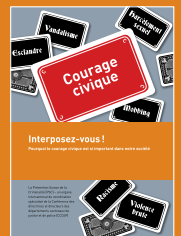
Brochure, A5, 36 pages, 2015

Agir courageusement en s'interposant quand quelqu'un a besoin d'aide ? Chacun de nous le souhaite. Or, passer à l'acte est une autre paire de manches. Car il ne suffit pas de vouloir, il faut aussi savoir comment se comporter dans certaines situations, et jusqu'où aller. La nouvelle brochure de la PSC fournit de nombreux conseils sur ce sujet d'une brûlante actualité.