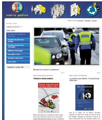
Le site Internet des corps de police ( www.votrepolice.ch ) informe sur les campagnes en cours

Les représentants des CCPC RBT (FR, GE, JU, NE, VD, VS, BE et TI) se retrouvent régulièrement pour des échanges et des discussions sur les projets communs. Le sous-groupe spécialisé est dirigé à tour de rôle par des responsables des services de prévention. Depuis 2014, les corps de police réalisent aussi des campagnes de prévention communes. En 2015, les campagnes auront pour sujets: vol à l'astuce, vol à l'arraché (date de lancement : 4 mai), « Ne pensez pas... qu'aux vacances! ... » (15 juin), vol de moteurs de bateaux (a démarré au printemps) et prévention contre les cambriolages (26 octobre). Le groupement de corps de police a désormais son propre site Internet ( www.votrepolice.ch ) qui regroupe toutes les informations concernant ces campagnes. Les cantons de Genève et de Vaud ont développé ensemble une application