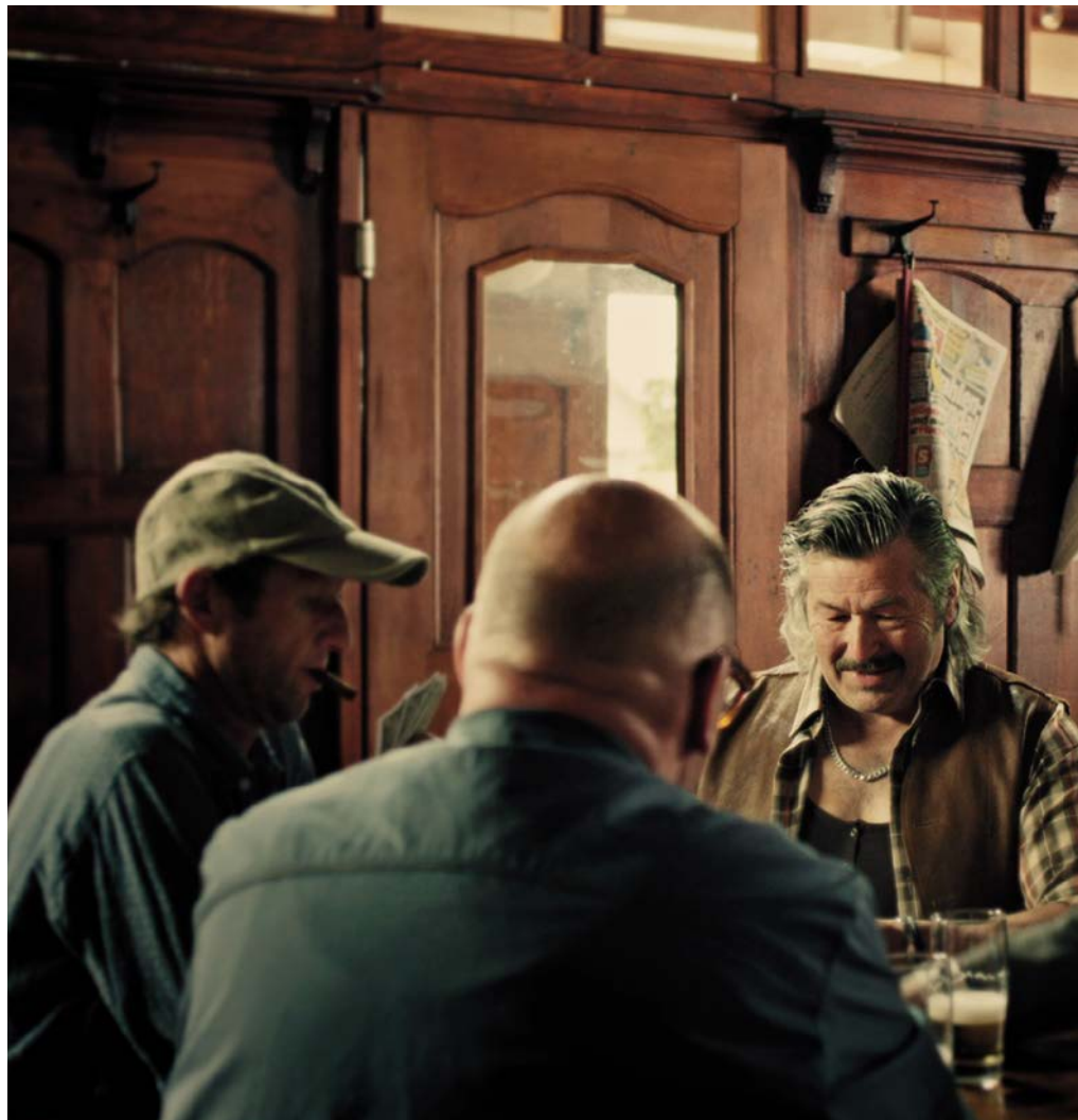
Le jeune homme s'interpose ... (scène du spot Carte rouge)

est une autre paire de manches. Car il ne suffit pas de vouloir, il faut aussi savoir comment se comporter dans cer-