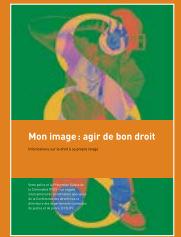
Dépliant, A5, 10 pages, 2015

Ce dépliant part de plusieurs cas de figure pour montrer jusqu'où va le respect du droit à sa propre image et ce qui peut être entrepris quand il y a infraction. Le dépliant explique les bases légales et informe notamment sur les éléments à prendre en considération lorsqu'il s'agit de photographier des enfants et des jeunes, afin de ne pas porter atteinte aux droits des mineurs à leur propre image.