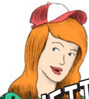
GIULIETTA LA SOGNATRICE