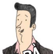
PAPÀ IL PRESUNTO CAMPIONE SPORTIVO